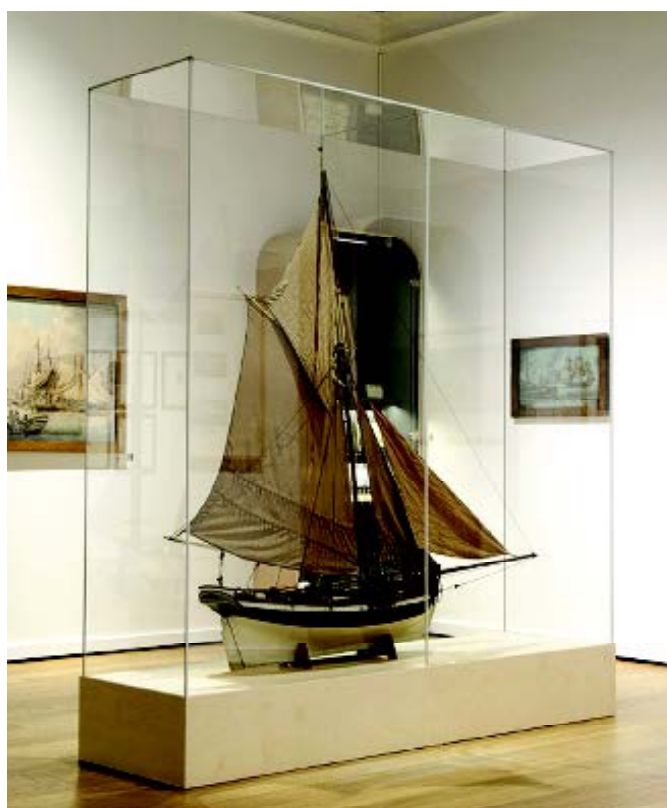
Vitrine Frank avec un socle sur mesure en MDF: NOUS CONSULTER.