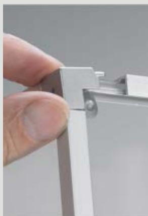
Assemblage d'un angle