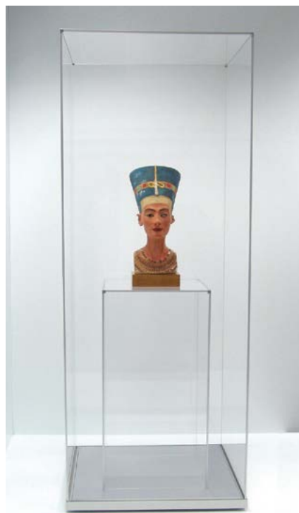
Vitrine colonne Frank Plexiglas®