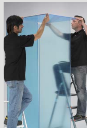
Montage de la structure