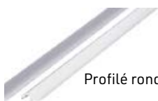
Profilé rond et profilé carré