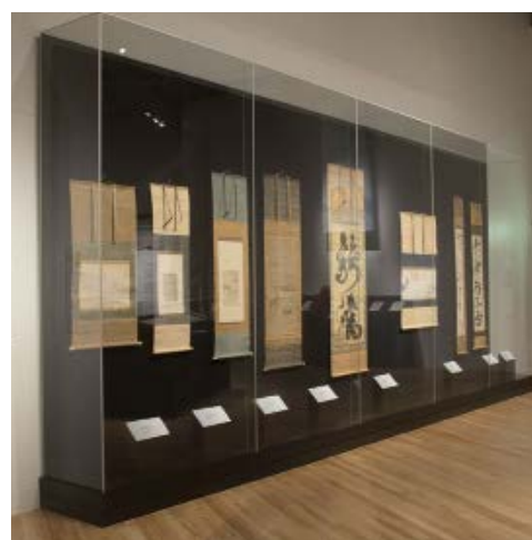
Exemple de réalisation de vitrine murale et vitrine table Frank